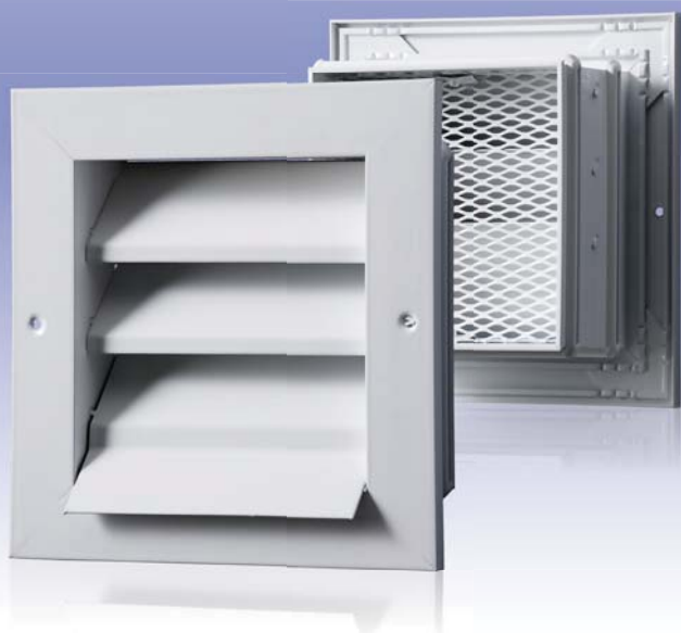
Приточно-вытяжная вентиляционная решетка с нерегулируемыми направляющими воздушного потока